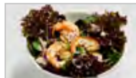
V18 BIG PRAWNS SALAT ABCFN