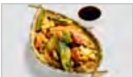
V06 TEMPURA GEMÜSE ACFN