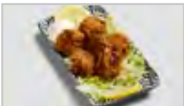
V04 KARAAGE CHICKEN ACFN 6 STK