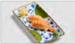
B24 EBI SUSHI ABFN GARNELEN