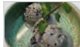
BLACK SESAMS EIS ACEFGN 2 Kugel