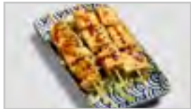
V22 TOFU ACF 3 STK.