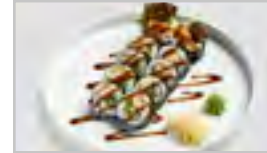
R17 CRISPY DUCK ROLL ACFN 10 STK KNUSPRIGE ENTE / GURKE / SALAT / MAYO