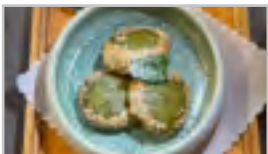
TARO KUCHEN ANH 3 Stk.