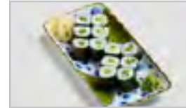
B28 KAPPA MAKI AFN