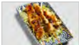
V24 HUHN ACF 3 STK.