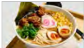
H31 HUHN ACF