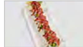
R21 TUNA ROLL ACDFN 8 STK. AVOCADO / GURKE / SESAM / THUNFISCHMANTEL