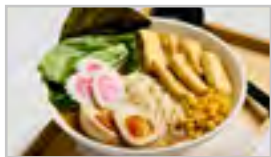
H30 VEGGIE ACF