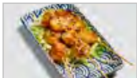
V21 MUSCHEL ACFR JAKOBSMUSCHELN | 3 STK.