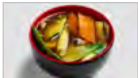
V12 YASAI ACF GEMÜSESUPPE