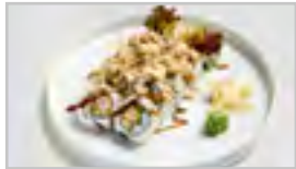
R13 EBI TEMPURA ROLL ABC FN 10 STK. KNUSPRIGE GARNELEN / GURKE / SALAT / MAYO