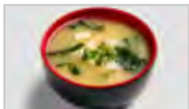
V09 MISO ACF JAPANISCHE SOJASUPPE