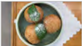
SESAMBALL NH 3 Stk.