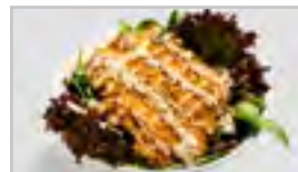
V19 CRISPY CHICKEN SALAT ACF KUNSPRIGES HÜHNERFILET MIT SALAT