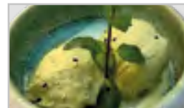
MATCHA EIS ACEFGN 2 Kugel