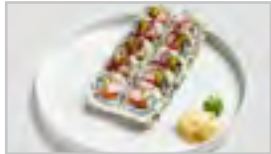
R11 PHILADELPHIA ROLL ACFNG 10 STK. LACHS / AVOCADO / FRISCHKÄSE / SURIMI / SESAM