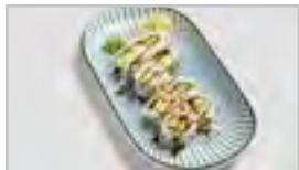
R16 INARI ROLL ACFN 8 STK. AVOCADO / GURKE / SESAM / EINGELEGTER TOFU