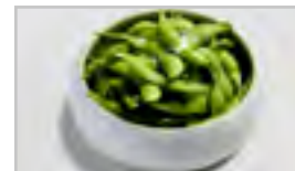
V14 EDAMAME ACF GEKOCHTE BOHNEN