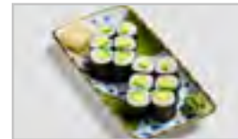
B27 AVOCADO MAKI AFN