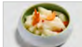
V20 CHINESISCHER RETTICHSALAT ( SCHARF ) N RETTICH / CHILI / KAROTTEN / SESAM