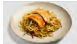
H25 LACHS ACDFN