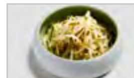
V15 SOJASPROSSEN - SALAT ACF