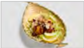
V02 TAKOYAKI ACFN 5 STK