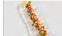
R22 FIRE SAKE ROLL ACDFN 8 STK. LACHSMANTEL FLAMBIERT / AVOCADO / GURKE / SESAM