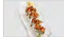
R19 SPICY TUNA (SCHARF) ACD FN 8 STK. CHILI MAYO / THUNFISCH / AVOCADO / SESAM