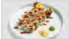
R12 LACHS TEMPURA ROLL ACDFN 10 STK. KNUSPRIGER LACHS / GURKE / SALAT / MAYO