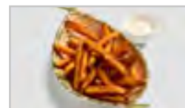
V16 SÜSSKARTOFFEL FRIES ACF