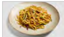
H20 VEGGIE ACFN