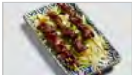
V23 RIND ACF 3 STK.