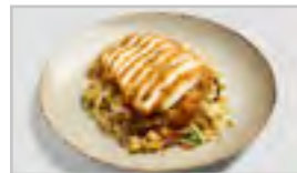
H22 CRISPY HUHN ACFN