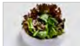
V17 SĒN SALAT ACF GEMISCHTER GRÜNER SALAT