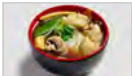
V11 WANTAN ACF GARNELEN MIT GEMÜSE IM TEIG