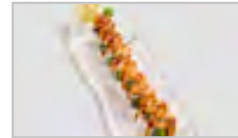
R20 SAKE ROLL ACDFN 8 STK. AVOCADO / GURKE / SESAM / LACHSMANTEL