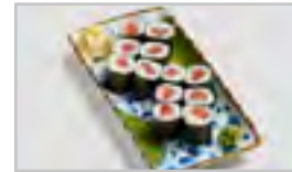
B30 TUNA MAKI ADFN