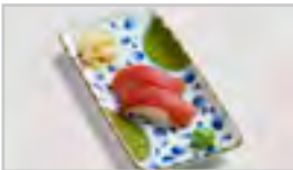
B21 TUNA SUSHI ADFN THUNFISCH