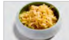
V13 PIKANTER SALAT (SCHARF) ACF SCHARFER KOHLSALAT