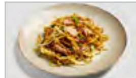
H23 RIND ACFN