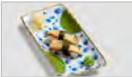
B25 UNAGI SUSHI ADFB AAL