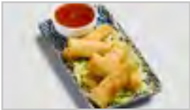
V01 MINI FRÜHLINGSROLLEN ACFLN 5 STK