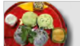
VARIATION FÜR 2 PERSONEN ACEFGN Mochi und Eis