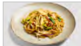
H21 HUHN ACFN