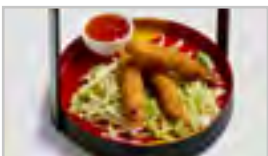
V05 TEMPURA GARNELEN ABCF 3 STK