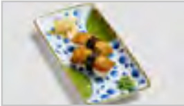
B22 INARI SUSHI AFN TOFU