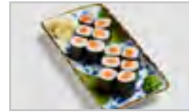
B26 SAKE MAKI ADFN