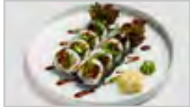
R10 BEEF ROLL ACFN 10 STK. WÜRZIGES RINDFLEISCH / GURKEN / SALAT