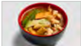
V10 TOM YAM GUNG ( SCHARF ) ABCDFN SCHARF-SAURE GARNELENSUPPE