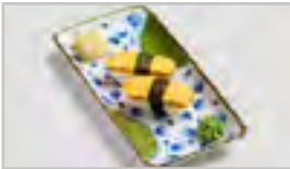
B23 TAMAGO AFN EIROLLE