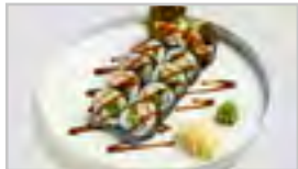
R15 CRISPY CHICKEN ROLL ACFN 10 STK. KNUSPRIGE HÜHNERFILET / GURKE / SALAT / MAYO