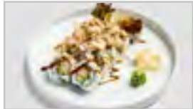
R14 CRAB TEMPURA ROLL ACFBN 10 STK. KNUSPRIGE KRABBE / SALAT / MAYO