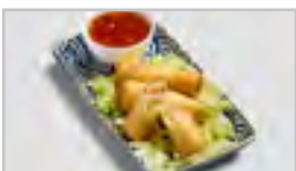
V07 KNUSPRIGE GARNELENROLLE ABCNF 3 STK