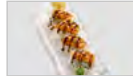
R18 SAKE TATAR (SCHARF) ACD FN 8 STK. CHILI MAYO / LACHS / AVOCADO / SESAM