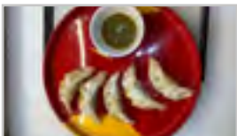
APFEL GYOZA ACNH 5 Stk.