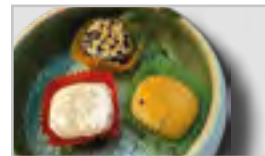
MOCHI AEFHGN 3 Stk.