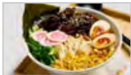
H32 RIND ACF