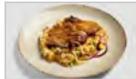
H24 ENTE ACFN