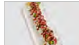
R23 FIRE TUNA ROLL ACDFN 8 STK. THUNFISCHMANTEL FLAMBIERT / AVOCADO / GURKE / SESAM