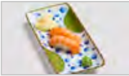
B20 SAKE SUSHI ADFN LACHS