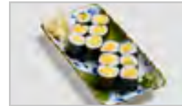
B29 TAMAGO MAKI AFN